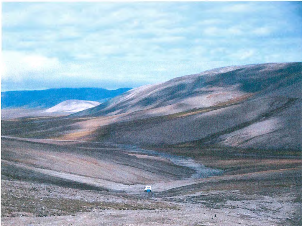
6. Наземная экскурсия на вездеходной технике