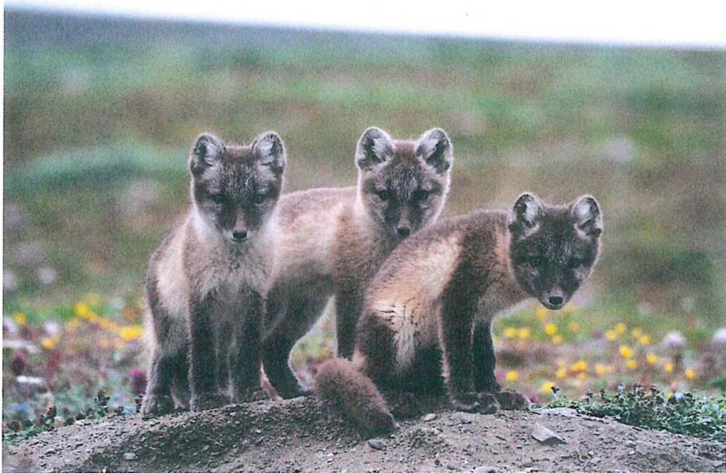
5. Щенки песца