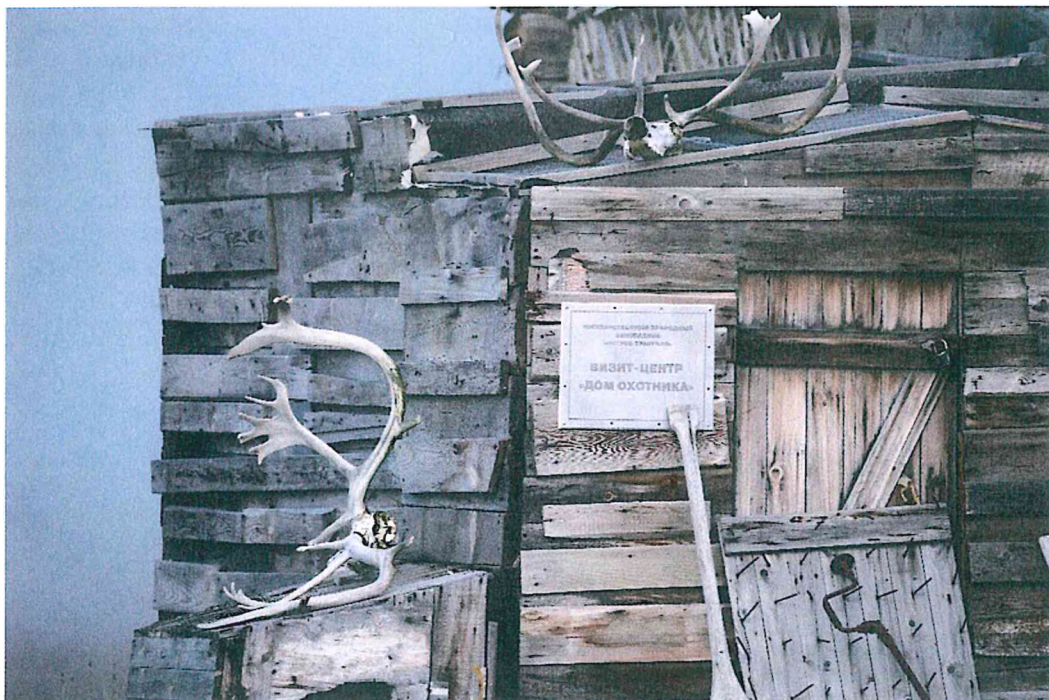
1. Дом охотника Ульвелькота