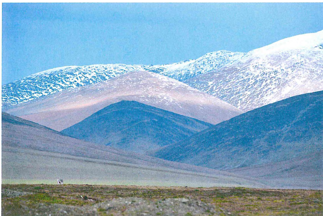
4. Вид на гори