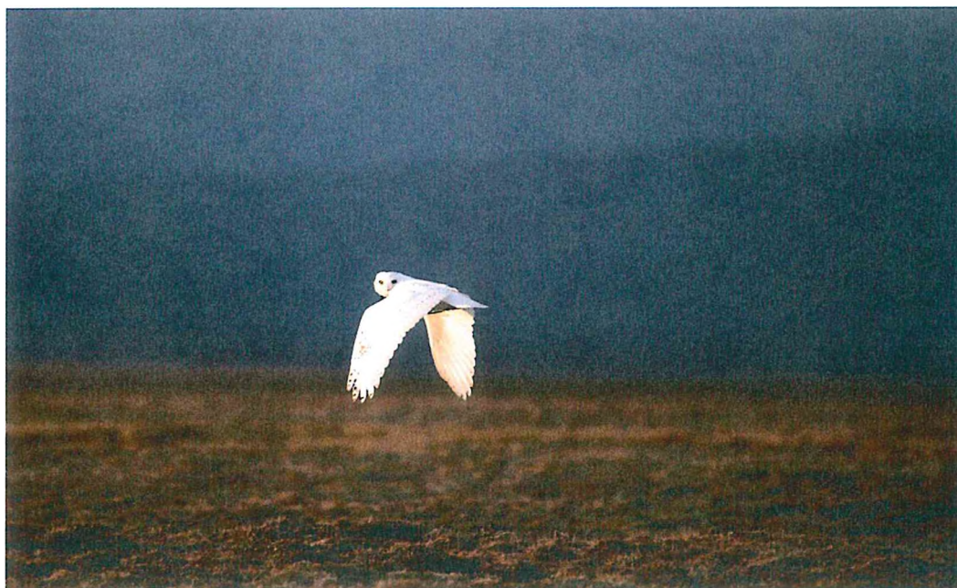
2. Полярная сова