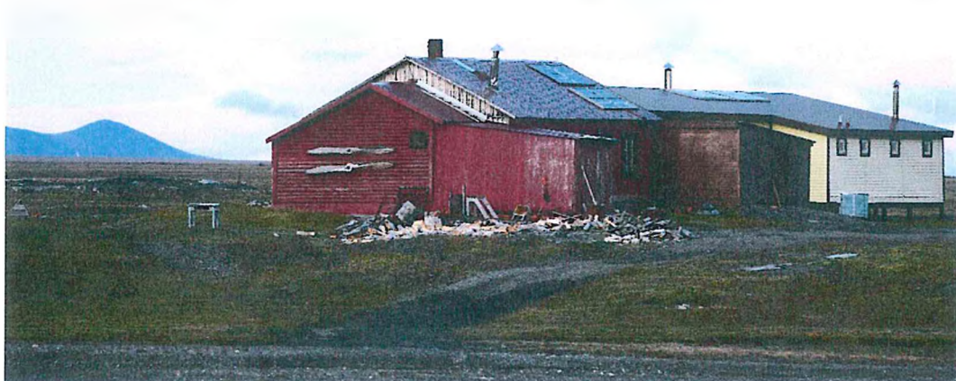
3. Кордон заповідника (База «Сомнительная»)