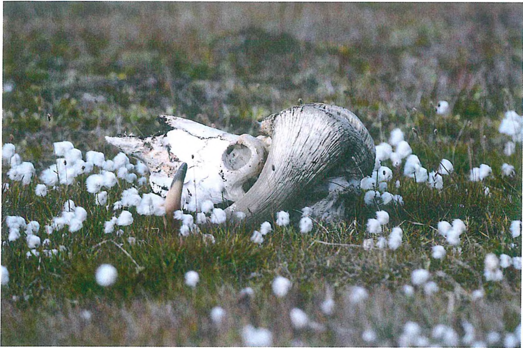
7. Череп овцебыка Автор: Придорожная Татьяна